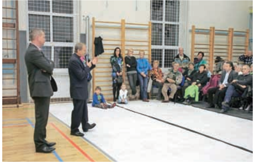
Konec novembra so odprli prenovljeno stavbo Sokolnice.

Obnovo spomeniško zaščitene stavbe ob samem vhodu v mestno jedro, ki je eden izmed treh najstarejših sokolskih domov v Sloveniji, so začeli sredi junija. Občina je namreč SŠD Tržič v začetku maja nakazala kupnino za bazen, ki so jo v skladu z dogovorom namenili za obnovo. Obnovili so vse vitalne dele zgradbe in uredili kletne prostore, kjer so garderobe in sanitarije. Nova je tudi streha, lepšo podobo so nadeli še vhodu v