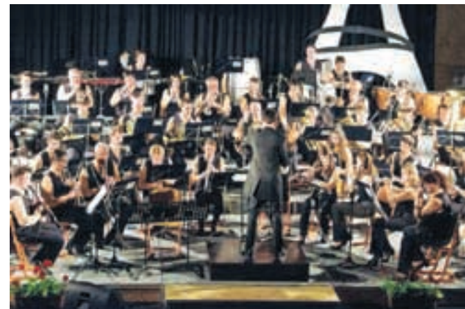
Pihalni orkester Tržič pripravlja nepozaben večer.