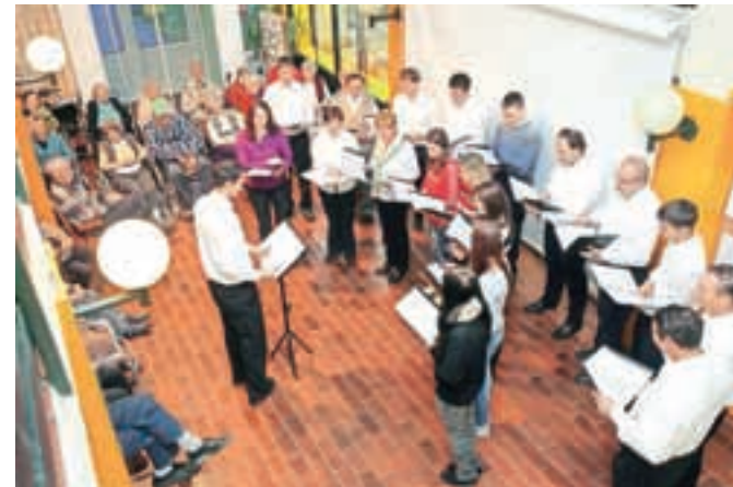
Prijeten četrtek popoldan z lepo zapeto pesmijo

V Domu Petra Uzarja je bila pred kratkim ponovitev koncerta S pesmijo po Koroški . Poleg Mešanega pevskega zbora Kres je nastopila tudi moška vokalna skupina Plamen. Koncert je organiziralo Kulturno društvo sv. Janeza Krstnika Kovor.