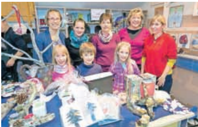
Izvorni izdelki POŠ Podljubelj.