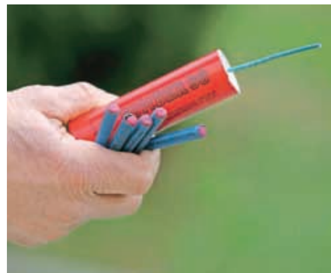
Uporaba petard je v Sloveniji prepovedana že od leta 2008.

»Nepremišljena, nepredvidna in obsejna uporaba pirotehničnih izdelkov povzroči tudi telesne poškodbe, kot so opekline, raztrganine rok, poškodbe oči in podobno, prav tako pirotehnični izdelki ne motijo le mnogih ljudi, temveč tudi živali in onesnažujejo okolje,« še opozarjajo policisti.