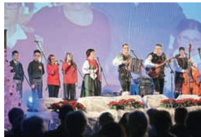
Člani Ansambla Zarja na odru Dvorane tržiških olimpijcev skupaj z dvojimi dvojčki