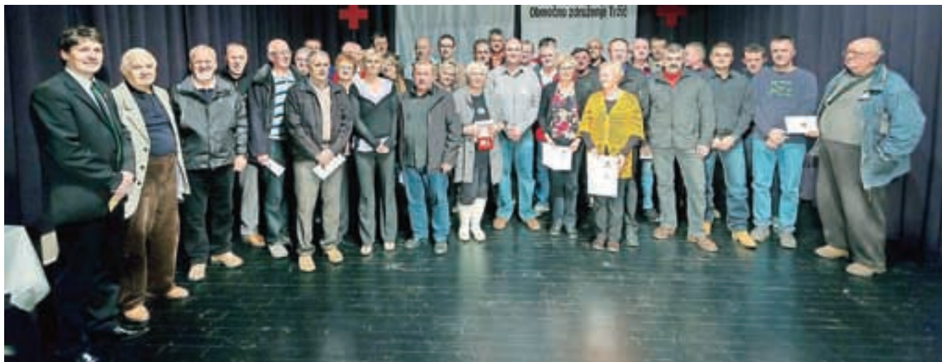
Nagrajeni krvodajalci tržiške občine na odru Kulturnega centra

Plesnega kluba Tržič, harmonikarji Glasbene šole Tržič, recitatorji Podružnične osnovne šole Lom, nastopil pa je tudi Pevski zbor Dobrča. Na prireditvi, ki jo je sproščeno povezoval David Ahačič, so obenem zbirali tudi prostovoljne prispevke in hrano ter tudi na ta način pomagali mnogim v stiski.