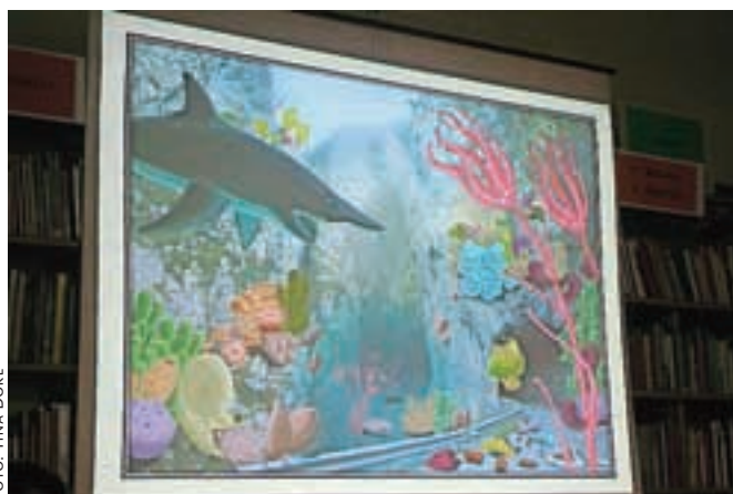
»Ilustracija na platnicah vodnika Dovžanova soteska je mišljena kot pozitivna provokacija,« je dejal Matevž Novak.