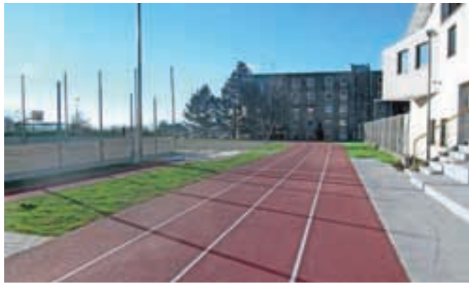
Glavni letošnji pridobitvi sta nova atletska steza v tartanski izvedbi in nova razsvetljava na igrišču.

ro sprejeto, saj so prejeli številne pozitivne odzive s strani športne javnosti in uporabnikov, so pojasnili na občinski upravi. Z obnovljenim igriščem so se bistveno izboljšale razmere za izvajanje športne vzgoje za učence OŠ Bistrica ter za nogometni klub NK Tržič 2012, tudi za treninge v večernih urah. Športno igrišče bo v dopoldanskem času na voljo za prednostno uporabo OŠ Bistrica, v popoldanskem in večernem času pa bo igrišče odprto za tržiške športne klube in druge uporabnike. Že v letu 2011 je Občina Tržič začela celostno ureditev športnih objektov v občini. V Križah so obnovili igrišče in zgradili tartansko atletske stezo, nogometno igrišče ter uredili košarkaško igrišča, sledila je ureditev notranje telovadnice v skalnem centru Sebenje za potrebe skalnega kluba.