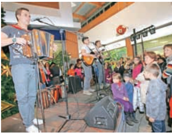
Gadi so zmagovalci letošnjega izbora za naj polko Radia Gorenc.

za besedo je skrbela tudi Saša Pivk Avsec, Peška je nasmejal občinstvo. Spoznali smo še ansambel Štimo, zaplesala je Akademsko folklorna skupina Ozara. Čisto za konec pa je Radio Gorenc otrokom predstavil še pravljičnega gosta: Škrata Gorenc, ki se je otrokom tokrat prvič predstavil v živo.