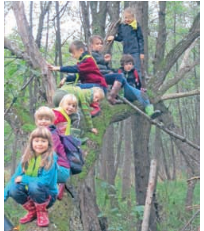
Pri pouku ne uporabljajo delovnih zvezkov, zato pa jim ostaja mnogo časa za raziskovanje narave.

vseh čutil skozi vse letne čase. Niti ogroženo bližnje mokrišče Blata ne ostaja neraziskano. Pišejo in berejo že vsi male in velike tiskane črke, v teh dneh pa so se poglobili še v velike in male pisane črke. Tudi opismenjujejo se malo drugače, po integrativni metodi, kjer se učijo pisanja in branja velike in male abecede hkrati. Vsake toliko časa se poglobijo tudi v zgodovinske osebnosti in dogodke. Temu primerno se napravijo ter ves dan uživajo kot kamenodobni ljudje, na grajskem, kavbojskem, škratovskem ali čarovniškem dnevu. Če boste na čisto običajen dan srečali učenca, ki bo napravljen v Krištofa Kolumba, pirata, viteza, je to prav gotovo učenec 2. a razreda OŠ Križe. In kaj te učence najbolj skrbi? Da jim bo zmanjkalo časa za spoznavanje novih šolskih doživetij.