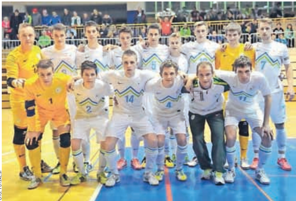
Naša mlada futsalska reprezentanca je najprej navdušila v Strahinju, nato pa še v Trziču.

Tekma je bila zanimiva, po uvodnih minutah prevlade gostov iz Poljske pa so naši mladi reprezentanti izkazali z lepo akcijo, po kateri je