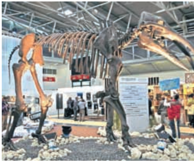
Originalni skelet gomfoterija, ki je bil postavljen le za prireditev v Münchnu.

Enako zanimiva je bila tudi tematska razstava fosilov, kjer so bili postavljeni na ogled nekateri originalni fosilni ostanki, ki jih ni mogoče videti niti v muze-