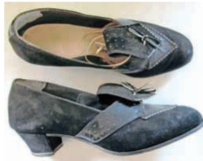
Par ženskih čevljev iz zbirke Tržiškega muzeja, narejenih okrog leta 1930 / FOTO: SONJA SLABE

Pred kratkim je ena od obiskovalk Tržiškem muzeju, doma iz Planine pod Golico, povedala njihovo različico tega besedila, in sicer: