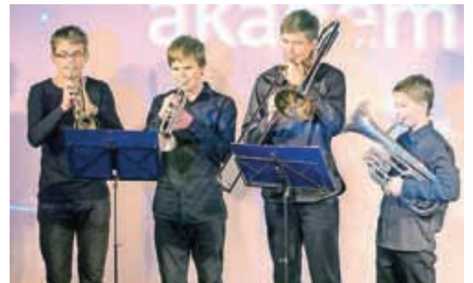
Trobilni kvartet Glasbene šole Tržič