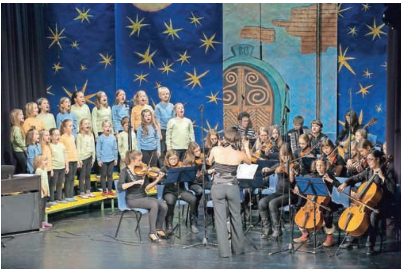
Godalni orkester s kitaristi/instrumentalnim triom in Otroški pevski zbor POŠ Lom pod Storžičem