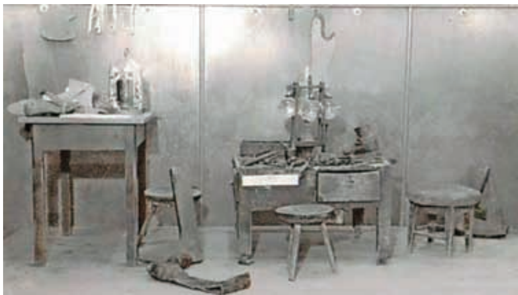
Čevljarstvo delavnica na prvi razstavi tržiškega muzejskega društva leta 1954

Tržiški muzej je bil formalno ustanovljen kot zavod 22. maja 1964, zato bomo v njem v letu 2014 pripravili nekaj novosti, ki bodo usmerjene v počastitev tega za tržiško muzejsko dejavnost tako pomembnega jubileja. Najpomembnejši projekt je vezan na prenovno čevljarstvo zbirke. Ta je bila v minulih petih desetletjih delovanja sicer večkrat delno prenovljena, do celostne prenove pa kljub številnim načrtom, ki so jih delavci muzeja pripravljali vse od devetdesetih let 20. stoletja, do danes ni prišlo. A zbrana je bilo veliko gradiva, prenovljeni so bili deli zbirke, javnosti je bila pretekla obutvena kultura oz. posamezna njena področja predstavljena na nekaj občasnih razstavah. Zbrano gradivo priča predvsem o tržiški čevljarstvu in tradiciji, deloma je vezano na širši slovenski